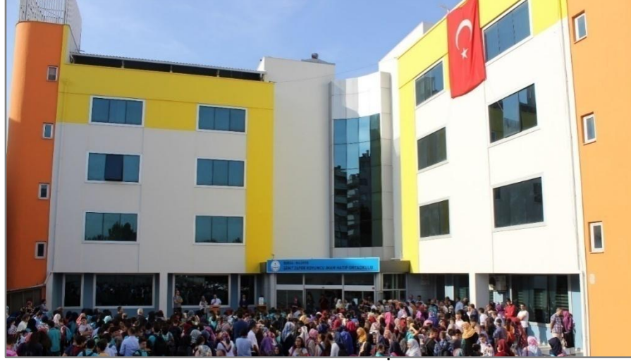
Nilüfer Şehit Zafer Koyuncu İmam Hatip Ortaokulu